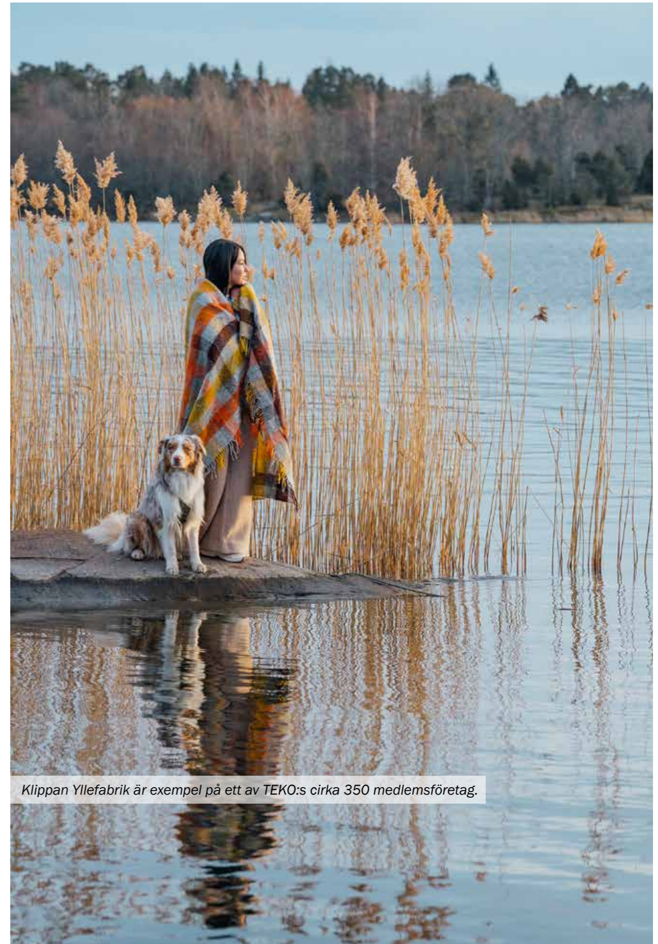
Klippan Yllefabrik är exempel på ett av TEKO:s cirka 350 medlemsföretag.

Tvätterier, tryckerier, brodyr, etiketter, textilvårdsprodukter, etc.